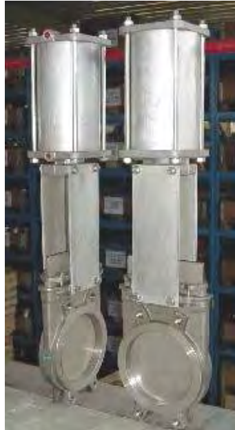
Type 022110 (Beispielabbildung) Type 022110 (example)